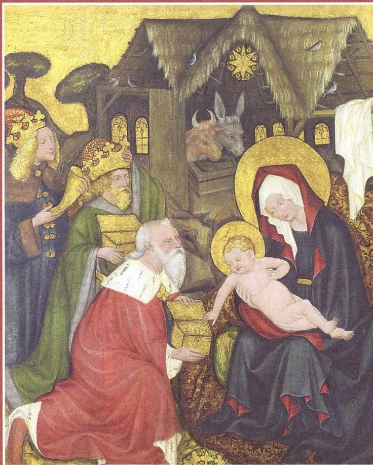
Meister des Jakobsaltars, tschechisch, 1430,

Die Anbetung der heiligen drei Könige