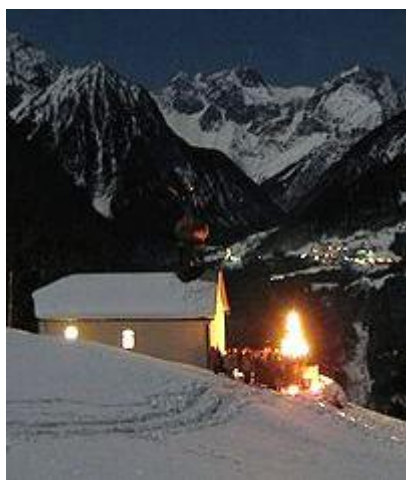
Christmette in der Bergparzelle Laz der österreichischen Gemeinde Nüziders

Das Wort Mette kommt vom lateinischen „matutinus“, das sich mit „morgendlich“ übersetzen lässt. Im Erzgebirge und in mittel- und süddeutschen Gemeinden ist noch heute ein Gottesdienst am frühen Weihnachtsmorgen Zentrum dieser festlichen Zeit. Im Mittelpunkt der meisten Gemeinden steht allerdings die Christvesper am Heiligen Abend oder der Festgottesdienst am Vormittag des ersten Weihnachtstages.