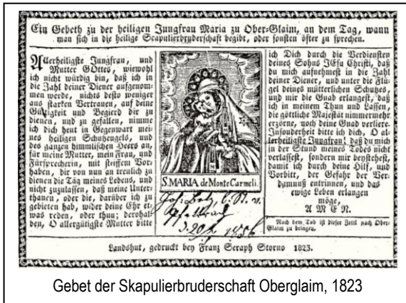
Gebet der Skapulierbruderschaft Oberglaim, 1823

Im Volksmund wird dieser Gedenktag auch Skapulierfest genannt. Diese Bezeichnung leitet sich vom Skapulier ab, einem Bestandteil des Ordenshabits. Besondere Bedeutung bekam das Fest durch die Verbindung mit dem braunen Skapulier. Dieses Sakramentale geht auf eine Vision des hl. Simon Stock zurück, einem Generaloberen der Karmeliten, dem die Gottesmutter Maria erschien. In der Vision trug sie ein Skapulier in der Hand und gab dem hl. Simon Stock das Versprechen, dass jeder, der es trage, unter ihrem besonderen Schutz stehe. Auch Angehörige anderer Orden und schließlich Laien baten dann, ein solches Skapulier tragen zu dürfen.