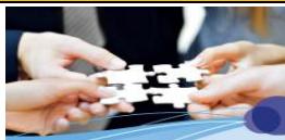
Gesellschaft und Leben