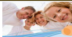
Familie und Co.