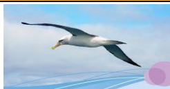
Sinn und Orientierung

Maximilianstraße 6 – 84028 Landshut – Tel.: 0871/92 31 70