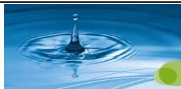
Gesundheit und Kreativität