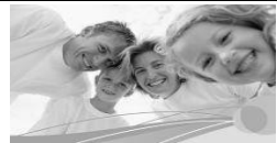
Familie und Co.