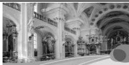
Kunst und Kultur