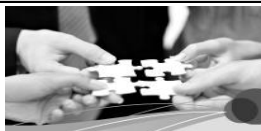
Gesellschaft und Leben