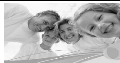
Familie und Co.