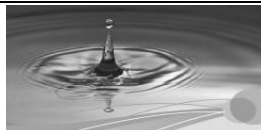
Gesundheit und Kreativität