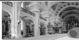
Kunst und Kultur