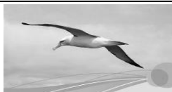
Sinn und Orientierung

Maximilianstraße 6 – 84028 Landshut – Tel.: 0871/92 31 70