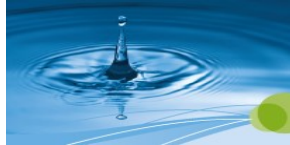
Gesundheit und Kreativität