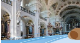
Kunst und Kultur