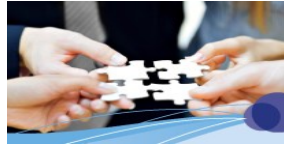
Gesellschaft und Leben