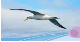
Sinn und Orientierung

Maximilianstraße 6 – 84028 Landshut – Tel.: 0871/92 31 70