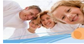
Familie und Co.