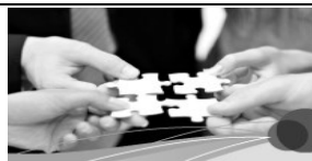
Gesellschaft und Leben