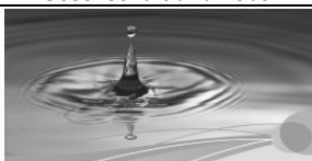
Gesundheit und Kreativität