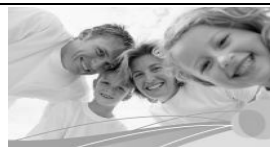
Familie und Co.