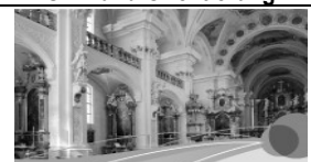
Kunst und Kultur