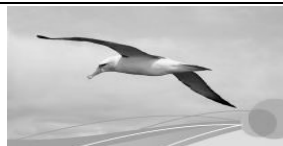
Sinn und Orientierung