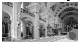
Kunst und Kultur