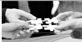
Gesellschaft und Leben