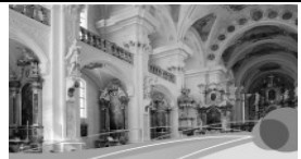
Kunst und Kultur