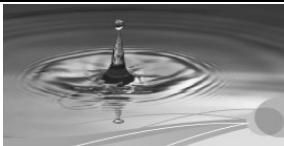
Gesundheit und Kreativität