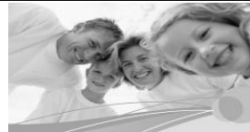
Familie und Co.