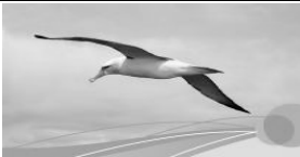
Sinn und Orientierung