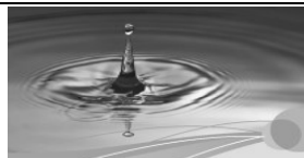
Gesundheit und Kreativität