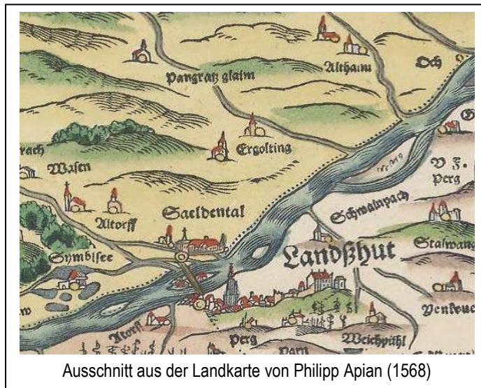
Ausschnitt aus der Landkarte von Philipp Apian (1568)

Zwar reicht die Siedlungsgeschichte des Marktes Ergolding bis ins dritte vorchristliche Jahrtausend zurück, doch war der unmittelbare Vorläufer des heutigen Ortes ein römischer Gutshof, der östlich der Straße nach Rottenburg lag. Das ergaben Freilegungen und Funde, die beim Autobahnbau 1979 gemacht wurden.