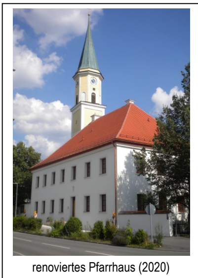
renoviertes Pfarrhaus (2020)

Saal des Kindergartens kann jederzeit für die Pfarrgemeinde als Festsaal dienen ...“ Über die soziale Schichtung schreibt er: „Hier ergibt sich ... das seltsame Bild, dass das alte Bauerndorf Ergolding sich nunmehr zusammensetzt aus fast 60% Arbeitern, davon etwa 10% Arbeiter mit bäuerlichen Rückhalt, 15% Bauern, 8% Angestellte und Beamte, 7% Handwerker und Geschäftsleute, und 8% Rentner ...“ Zusammenfassend stellt er fest: „Ergolding ist eine alte Pfarrei im Umbruch ...“