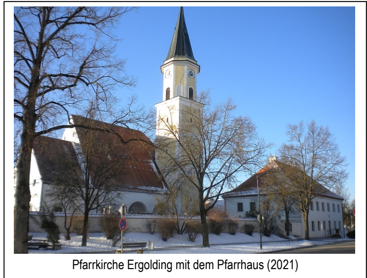
Pfarrkirche Ergolding mit dem Pfarrhaus (2021)