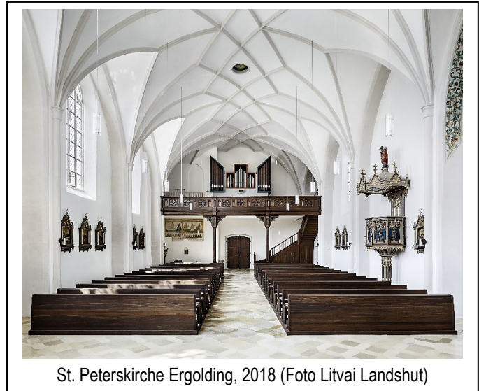
St. Peterskirche Ergolding, 2018

Leider blieb die Pfarrei von der Austrittswelle durch den Missbrauch in der kath. Kirche nicht verschont. Aber viele engagierte Frauen und Männer beteiligen sich am Pfarreileben und wollen so den Menschen „Halt und Heimat“ geben und Kirche vor Ort erfahrbar machen: wie z. B. der Kath. Frauenbund (KDFB), die Kolpingsfamilie (KF), die Senioren-gemeinschaft, der Kinder-, Jugend- und Kirchenchor sowie der VdPJ (Verein der Pfarrjugend), die v. a. Kinder und Jugendliche zum Mitmachen einlädt (Zeltlager, Gruppenstunden, Sternsinger, Ministrantenarbeit, ...).