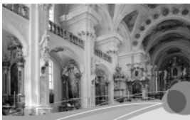
Kunst und Kultur