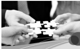
Gesellschaft und Leben