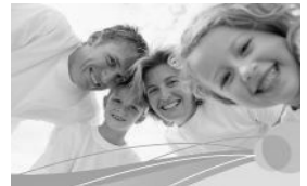
Familie und Co.