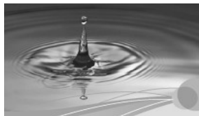
Gesundheit und Kreativität