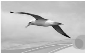
Sinn und Orientierung

Maximilianstraße 6 – 84028 Landshut – Tel.: 0871/92 31 70