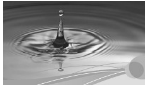
Gesundheit und Kreativität