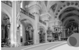
Kunst und Kultur