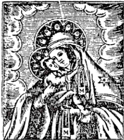
S. MARIA de Monte Carmeli.

Unerheiligste Jungfrau, und Mutter Gottes, wiewohl ich nicht würdig bin, daß ich in die Zahl deiner Diener aufgenommen werde, nichts desto weniger aus starken Vertrauen, auf deine Gültigkeit und Begierd dir zu dienen, und zu gefallen, nimm ich dich heut in Gegenwart meines heiligen Schutzengels, und des ganzen himmlischen Heers an, für meine Mutter, mein Frau, und Fürsprecherin, mit steifem Vorhaben, dir von nun an treulich zu dienen die Täg meines Lebens, und nicht zuzulassen, daß meine Untertanen, oder die, darüber ich zu gebieten hab, wider deine Ehr et was reden, oder thun; derohalben, O allergütigste Mutter bitte